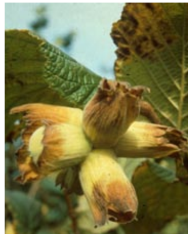
'Lambert Filbert' er den bedste sort til haver. Desuden er den god til dekoration pga. de lange haser.

Hjertenød er en variant af Japansk Valnød og skal opformeres ved podning, hvis man ønsker sikkerhed for hjerteformede