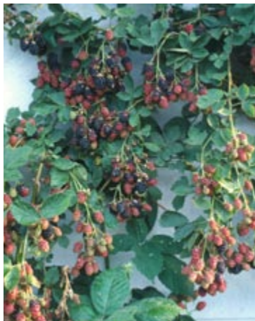
'Thornfree' er som navnet siger en brombær uden torne. Udbyttet er stort.

Fallgold har gul-orange bær. Sorten er sund men ikke så frugtbar. Den har små, søde, velsmagende gule bær egnede til at spise friske.