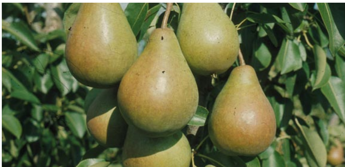
'Pierre Corneille' er en frugtbart pære med søde, saftige frugter med en krydret aroma.

Grev Moltke er en gammelkendt, hårdfør havesort. Træet er frugtbart, og frugten er saftig, sød og aromatisk. Egnet til syltning.