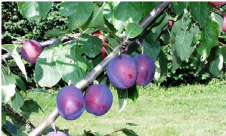
'Jubiläum' har meget store blårøde velsmagende blomster.