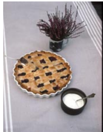
Brombær er gode til tærter.

Blåbær og Tyttebær er surbundsplanter ligesom Rhododendron. De kræver en lav pH-værdi og et højt humusindhold i jorden, gode læforhold, fuld sol og meget vand for, at kunne give bær. De giver ikke bær i tætte