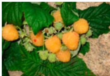
'Fallgold' er en gulorange efterårsbærende hindbærart.

Efterårsbærende hindbærarter giver bær på skud, der er vokset frem samme sommer. Derfor modner bærrene fra august og over en lang periode. I februar eller marts klippes alle skud af helt nede ved jorden. Derved udgås angreb af hindbærbillens larver, som ellers er årsag til "orm i hindbær". Hvis ikke alle skud fjernes ved beskæring giver efterårsbærende sorter også bær på 2. årsskud som almindelige hindbær.