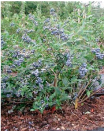
'Duke' er en ny spændende blåbærsort fra New Zealand.

Duke er en sund og frugtbar busk med god vækst. Bærrene sidder i store klaser og begynder, at modne fra først i august.