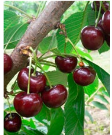
'Skeena' er en ny selvbestøvende sødkirsebærssort.