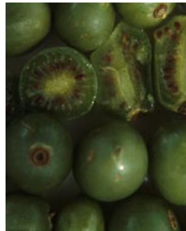
Minikiwi ligner alm. Kiwi inden i.

Isaii er en slyngplante med en svag vækst. Sorten har både han- og hun-blomster og er derfor