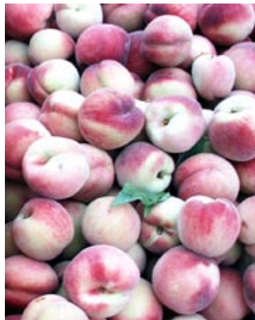
Fersken sorten 'Frost' er orange og 'Benedikte' er lys.