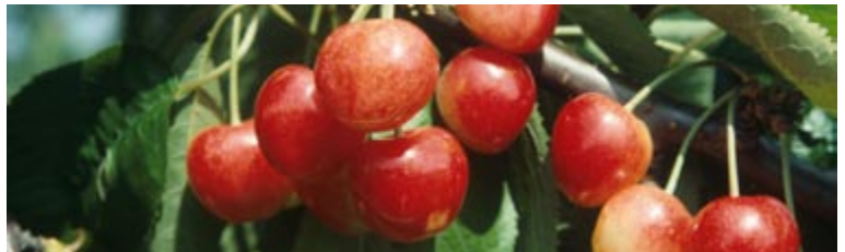
'Merton Glory' har flotte store gulgule frugter, som modner sidst i juli.

hvor bærene kan sidde på træet længe. Træet er meget dekorativt med mange små, lysende bær i august måned.