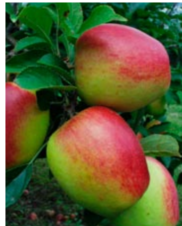
'Retina' har flotte frugter med en frisk syrlig-sød smag.

Topaz er meget frugtbar. Frugterne er fladrunde, gulgrønne med orangestribet dækfarve og en frisk, syrlig smag. De skal plukkes i oktober, men smager bedst efter jul. Sorten kræver mere beskyttede forhold for at trives. Find en solrig plads i haven med et godt læ. Det er en af de nye sorter, der er forholds-