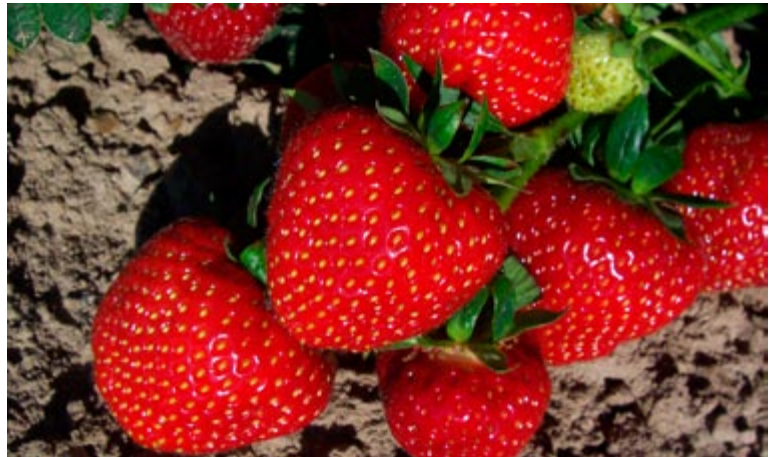
'Sonata' er en ny meget velsmagende jordbærsort til de danske haver.

Dania er en sen kraftigvoksende frugtbar sort, med nogen modtagelighed for gråskimmel. Bærrene modner sent og er store, dybrøde med en mild smag.