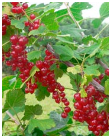
'Random' har flotte skinnende røde bær med en karakteristisk ribssmag, som er gode til rysteribs