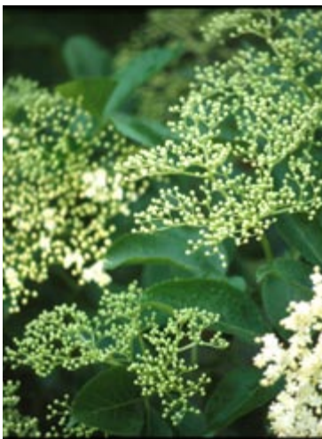
Hyldeblomsterne er utroligt flotte og kan bruges til Hyldeblomst drik.

Sommerskuddene/de bærende skud af druer skal have 7 blade per klase inden de kortes ind. Derved sikres, at sorter, der først sætter klaser på 3-5 knop, får lov at bære frugt, samt at planten