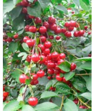
'Safir' er en ny surkirsebærsort med lys saft. Træet har fin prydværdi pga. hængende grene med mange bær.

Carlsen Skiødt er en kraftigt voksende sort. Frugterne modner middeltidlig og er store skinnende og mørkerøde.