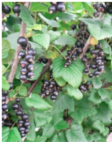
'Narve Viking' er en sund busk med søde bær, som kan spises direkte fra busken og samtidig er gode i husholdningen.