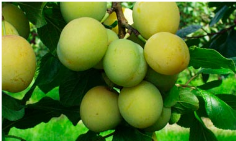
'Oullins Reine Claude' er en stor, gul, saftig blomme.

blomme. Den er mere sikker i bæringen end Italiensk Sveske, men kvaliteten er knap så god. I dårlige somre er blommen lidt tør med en jævn spisekvalitet.