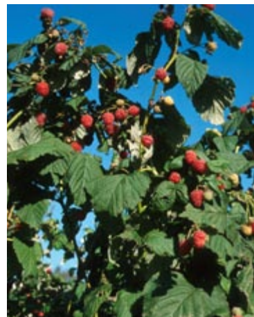
'Autumn Bliss' er vores mest kendte efterårsbærende hindbærssort. Hindbæriller (orm i hindbær) kan undgås ved at bruge denne sort.

Tulameen er en ny canadisk sort, som i Danmark modner fra sidst i juli. Bærrene er meget store, lyserøde, ensartede, faste og med en god smag. Udbyttet er højt og bærrene er nemme at plukke. Sorten er velegnet som dessertbær, men er også gode til