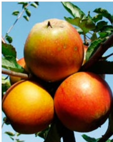
'Holsteiner Cox' er en frøplante af Cox's Orange'. Sorten er meget sund og frugtbar med en aromatisk smag.

Rubinola vokser opret. Frugterne er kugleformede, med orange ofte småstrøbet dækfarve og er saftige med en frisk syrlig smag. Robust overfor svampesygdomme.