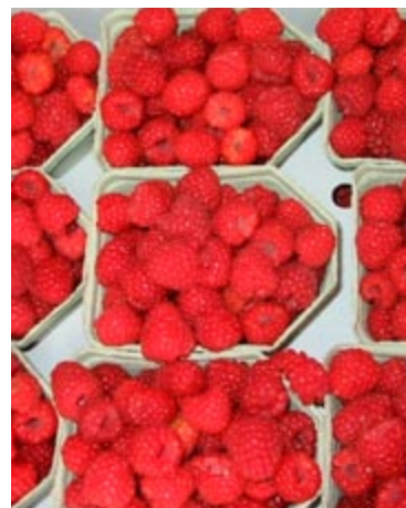
'Glen Ample' er en ny velsmagende sort.