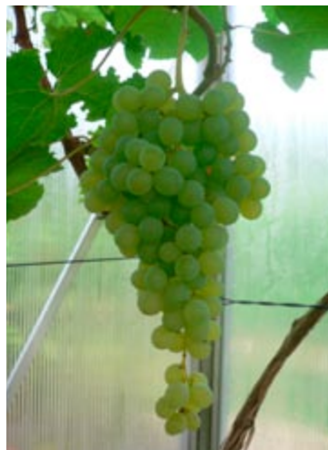
'Himrod' er en sød kerneløs drue med muscatmag til koldhus eller udestue.

Beauty er en middelstor, fast, kerneløs blå drue. Den fineste