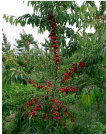
Svagtvoksende grundstammer som 'Gisela 5' giver små træer, som er frugtbare hurtigt efter plantning.

Merton Late er et svagtvoksende, meget frugtbart træ,