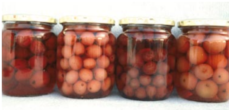
Paradisæbler kan både bruges til gele og syltes hele.

Fersken dyrkes under danske forhold bedst espalieret op ad sydmur eller i drivhus. Til begge formål er sorter med moderat vækstkraft at foretrække. Den udbredte ferskenblæresyge kan forebygges dels ved at vælge de mest modstandsdygtige sorter dels ved, at de unge blade beskyttes af et halvtæg eller et udhæng og fjerne alle angrebne blade. Ferskenblæresyge optræder stort set ikke i drivhus. Fersken er selvbestøvende.