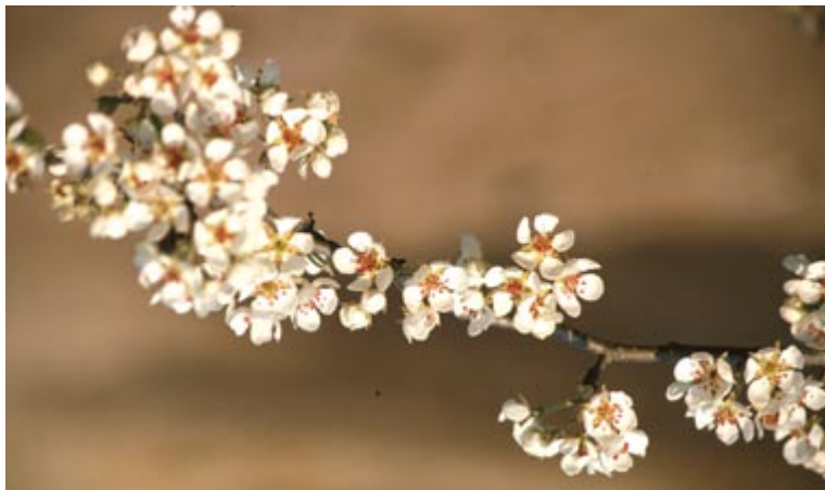
Blomster af 'Conference' pærer.

Kvæde C er en svagere og meget frugtbart grundstamme. Den bør vælges til espalier på god jord, og hvor man ønsker små træer. Træerne bærer tidligere på Kvæde C. Træer på denne grundstamme behøver en støtte pæl. Til nogle sorter bruges mellem-podning med sorten Clara Frijs. Kvæde C er mere følsom for hård vinterfrost end de andre grundstammer. Ikke alle plan-tehandlere har træer på denne grundstamme.