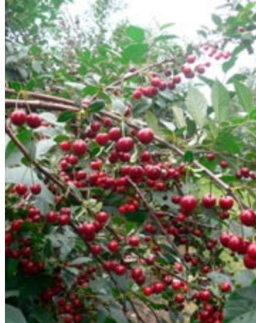
'Tiki' har små bær med en meget fin farvet saft og et stabilt udbytte.

Safir har meget store bær, som giver en mørk saft. Træet er meget frugtbart, ikke så stort, og har en god sundhed. De store, lidt bløde bær er gode til syltning. Flot prydræ med mange bær på hængende grene.