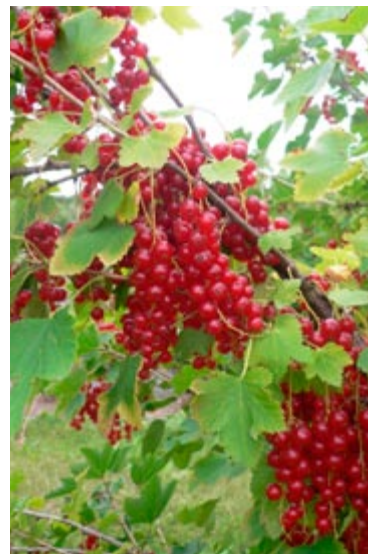
'Rolan' er en ny ribssort, som har en mild smag og derfor smager godt direkte fra busken.

Hvid Hollandsk er en kraftigt voksende, opret busk. Bærrene modner i juli og er gulhvide og søde. De er gode at spise direkte