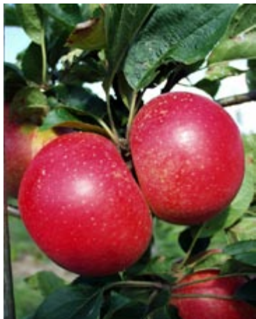
'Discovery' er en frugtbar sort med flotte lysende røde frugter allerede sidst i august.

er helt lysende rød. Sorten bør udtyndes, hvis der ønskes store velfarvede frugter.