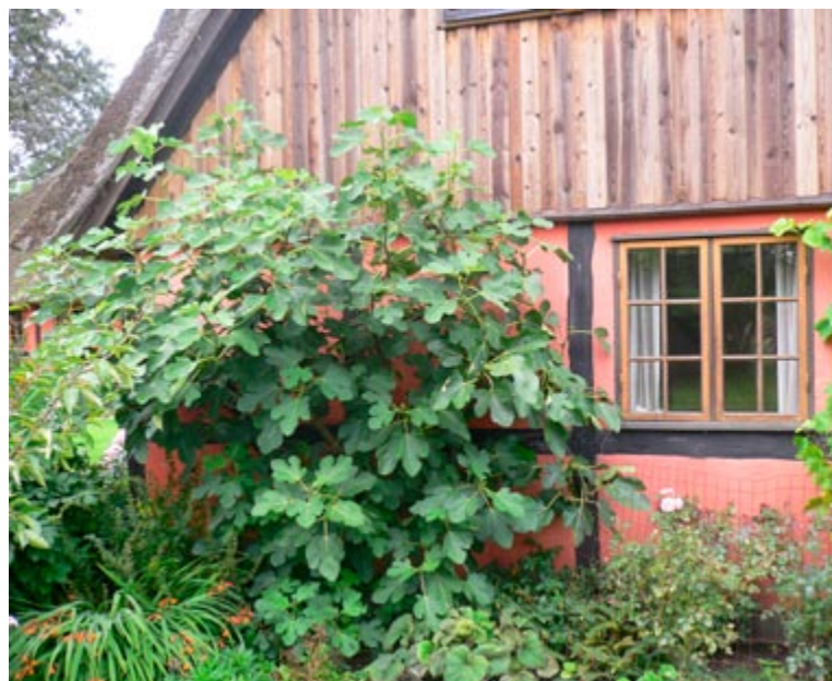
Figen trives bedst op ad en syd- og drivhus i de sydlige egne af landet.

sat mange frugter. Løjnefaldende lyserøde blomster. Stor vinterhårdførhed og relativ god modstandsdygtighed mod ferskenblæresyge. Egnede til syd- og drivhus.