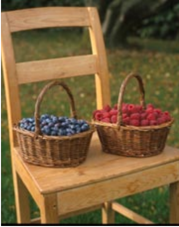
I august modner efterårsbærende hindbær og blåbær samtidig.

hurtigt i bæring. Bærrene modner tidligt fra sidst i juli.