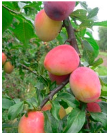
'Komet' er en ny mirabellesort, som både er et prydt træ og har velsmagende mirabeller.

abrikos og frugtkødet slipper stenen let. Velegnet til syltning som hele frugter.