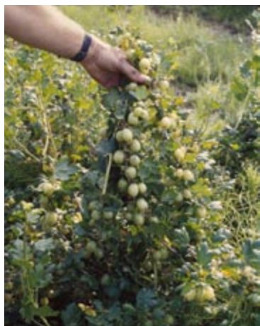
'Invicta' er en sund busk, som de fleste steder stadig er modstandsdygtig mod stikkelbærdræber (meldug).

Invicta er en nyere sort, der navnlig har den fordel, at den er modstandsdygtig mod den