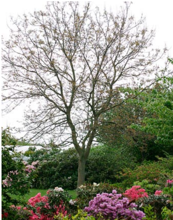
Valnøddetræer bliver store og flotte i haven.