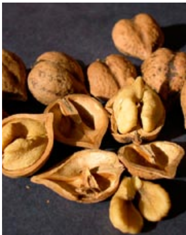
Hjertenød er en variant af Japansk Valnød og endnu er der kun få træer i Danmark.

Geisenheim 139 (G139) . De fine mellemstore valnødder kommer helt rent ned fra træet ved