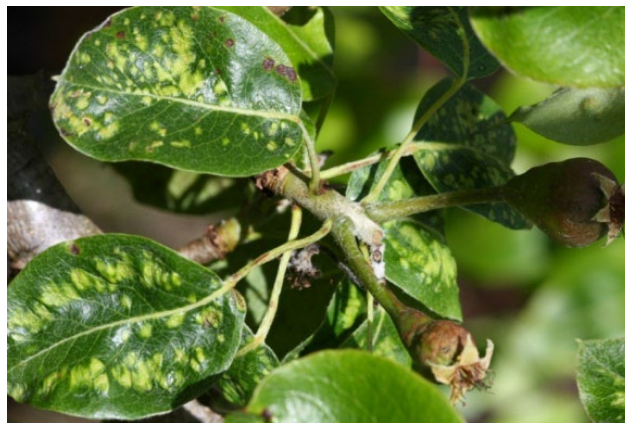
Bladgalmider kan ødelægge både blade og frugter.

Som følge af reduceret brug af sprøjtemidler i pæreplantagerne er der dukket endnu et relativt ukendt skadedyr op hos erhvervsfrugtavlere: Pærebladgalmiden. Bladenes funktion hæmmes af bladgallerne, og når angrebet er stort, kan gallerne også findes på frugterne. Skadedyret er nemt at holde væk, når der bladgødskes med svovl ved løvspring samt efter høst.