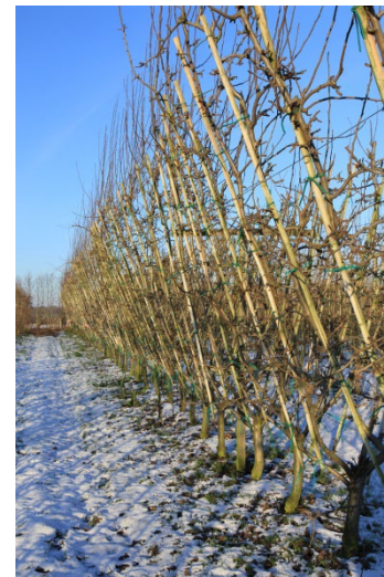
Plantesystemer: Intensiv spindel, to toppe system og V-system.