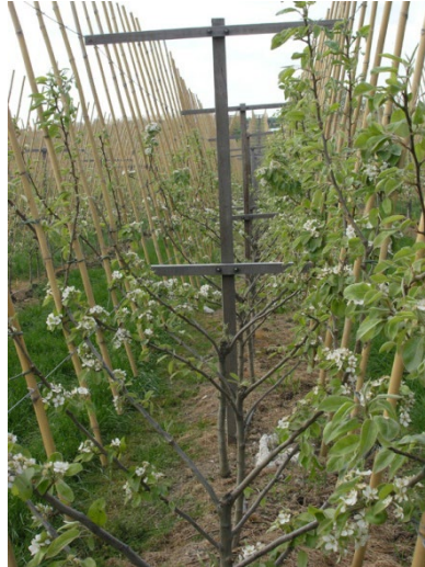
Opbindingsstativ til V-system. Længden på den øverste tværstolpe bestemmer vinklen på stammerne. Husk at tage hensyn til ønsket vinkel, når rækkeafstanden regnes ud.

Afhængigt af lokalitet er dyrehegn nødvendigt.