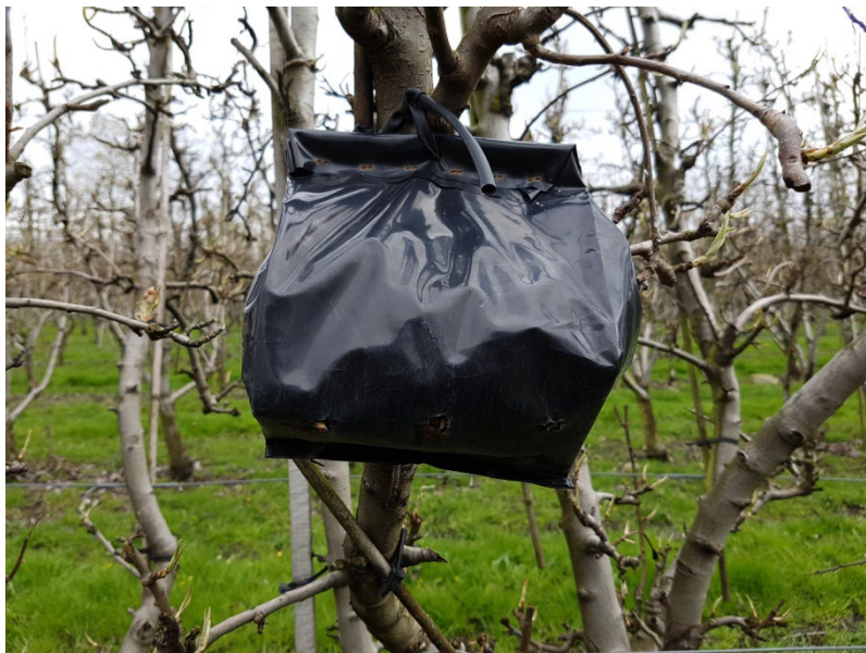
Ørentvisterbo lavet af plastpose med halm.

Lav bosteder til naturlige fjender, som ørentvister. Opsæt et ørentvisterbo i ca. hvert 8. træ. Her trives ørentvister, og forhåbentlig vil bestanden opformeres, så de kan spise en masse pærebladlopper. Du laver nemt et ørentvisterbo ved at fylde en pottepose med halm, clipse den sammen og sætte en elastik eller et bånd i posen, så den kan hænges op i træet.