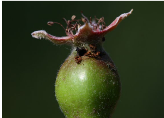
Angreb af pærebladgvæpse.