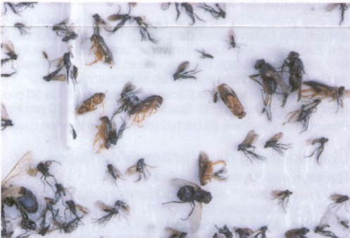
Æblebladhvæpse fangst på limplade (Hanne Lindhard)