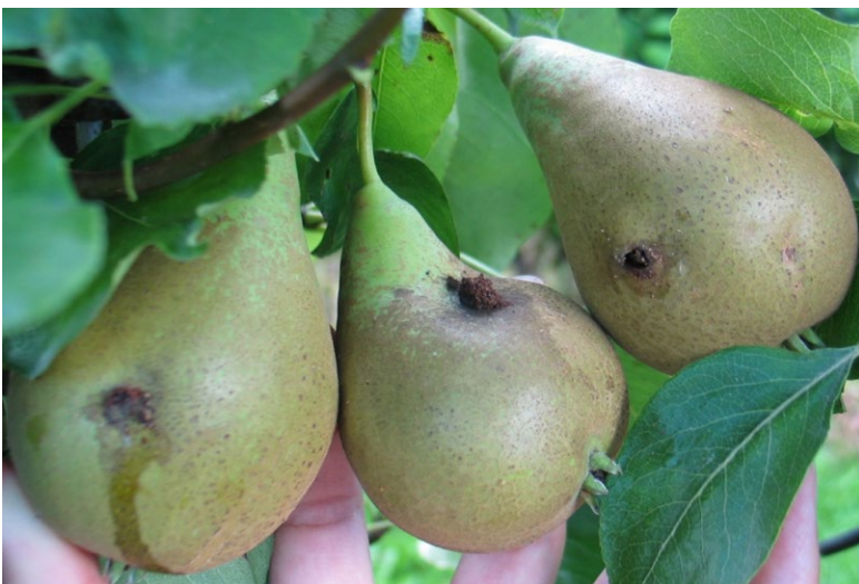
Angreb af æblevikler i pærer (Maya Bojesen)