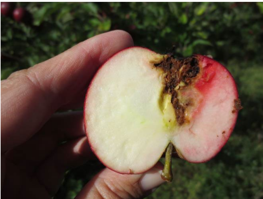
Angreb af æblevikler i æble (Hanne Lindhard)

Æblevikleren giver tilsvarende skader på pærer, men angreb er ikke lige så hyppige.