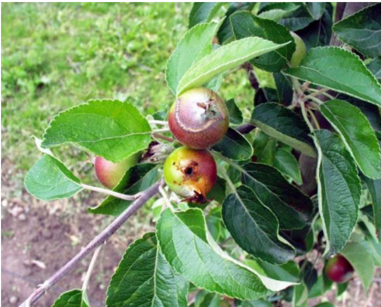
Små frugter angrebet af æblebladhvepse sidst i juni. Frugten med brunt frugt pulp vil falde af. (Hanne Lindhard)