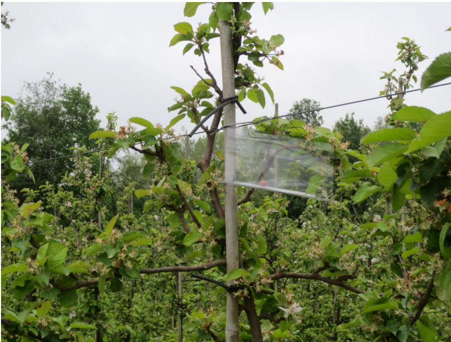
Feromonfælde opsat på øverste espaliertråd (Hanne Lindhard)