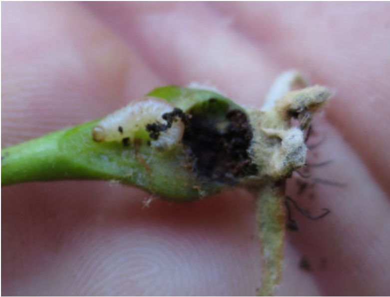
Pære angrebet af pærebladhveps (Hanne Lindhard)