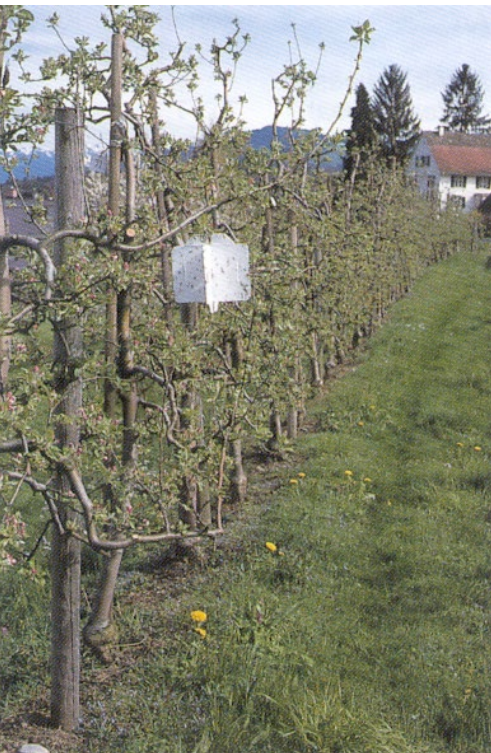
Limplade til fangst af æblehvæpse ophængt i plantage (Hanne Lindhard)