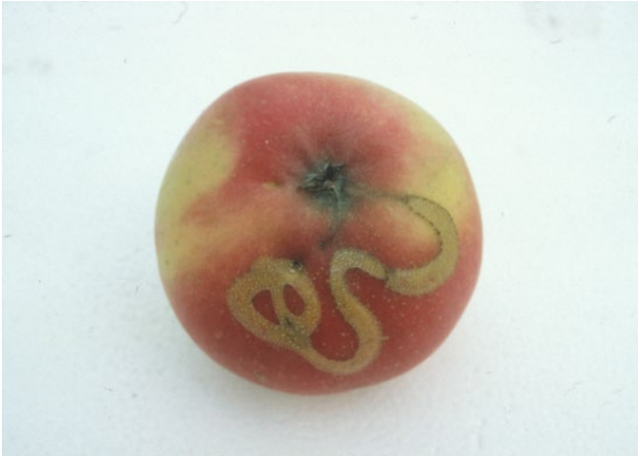
Æblesorten Discovery med forkorkede tidlige angreb af æblebladhvepsen (Hanne Lindhard)

Angreb kan give meget stor udbyttereduktion. Specielt på følsomme sorter som Discovery, Gråsten og Pigeon. Specielt i Discovery er der set næsten total frugtfald pga. angreb af æblebladhvepse. Mindre angreb kan give en nødvendig udtynding af frugter, men angreb accelerer over år.