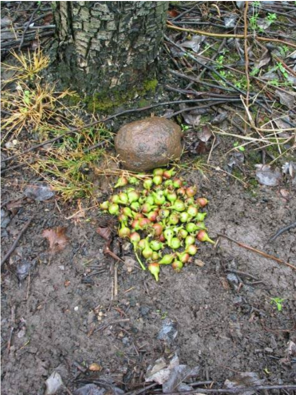
Pærer angrebet af pæregalmyg. Indsamlet til brug i spandfælde (Maya Bojesen)